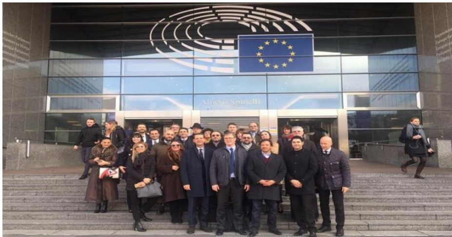
Visite degli imprenditori a Bruxelles