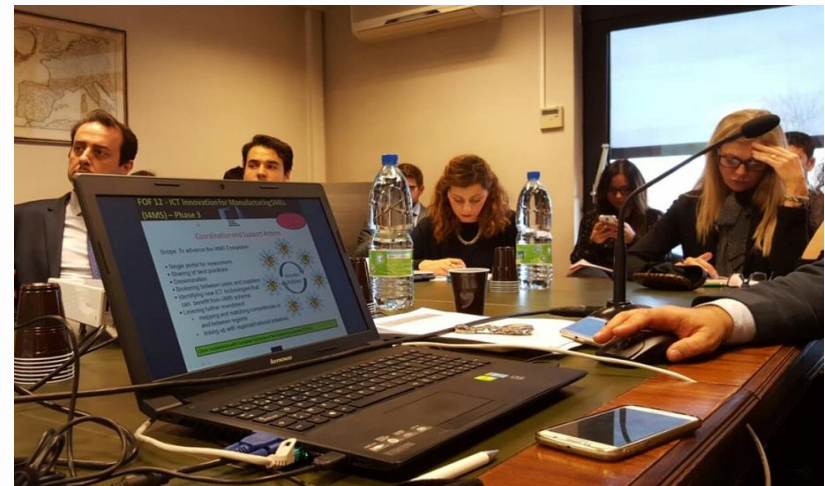
Seminari e attività sul territorio